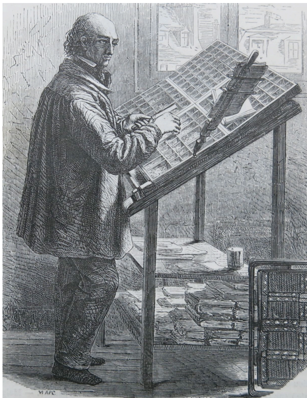
Figure 3 – L'ouvrier typographe

dans la poche droite, chapeau à large bords, tel est son costume habituel" 30 . Tout au long de ce siècle de grands travaux à Paris, de chantiers presque permanents, la blouse du maçon ou du peintre, le velours du charpentier faisaient partie du décor de la rue. Mais il reste à dire peut-être l'essentiel [152] : la blouse était aussi une tenue de travail dans les ateliers et les usines. On pénètre là dans un domaine très peu connu de l'histoire du travail, mais que la blouse ait été portée au travail par certains ouvriers est hors de doute ( Figure 3 ) :