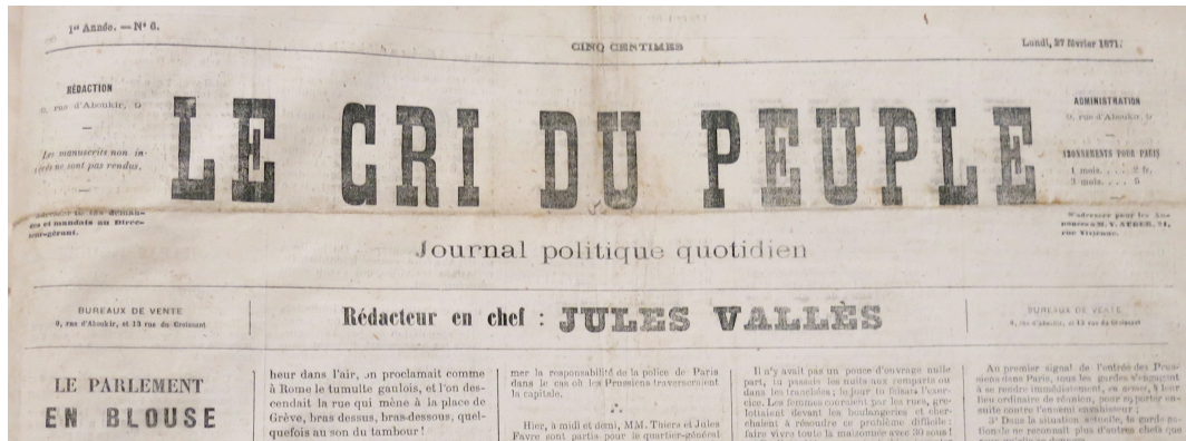
Figure 1 – En-tête du Cri du Peuple du 27 février 1871

"Les habits" et "les blouses" : l'expression allait rester pour dire les bourgeois et les ouvriers, supposés être opposés en tout et se faisant la guerre. Jules Vallès a constamment usé de l'opposition entre "gens en redingote" et "gens en blouse" 17 (Figure 1). On pourrait accumuler les textes politiques et militants qui, jusque dans les années 1880 encore, filent cette métaphore vestimentaire. Mais ne faisait-elle pas fi de la diversité des pratiques vestimentaires des ouvriers et de leurs sentiments propres dans la façon de se vêtir ?