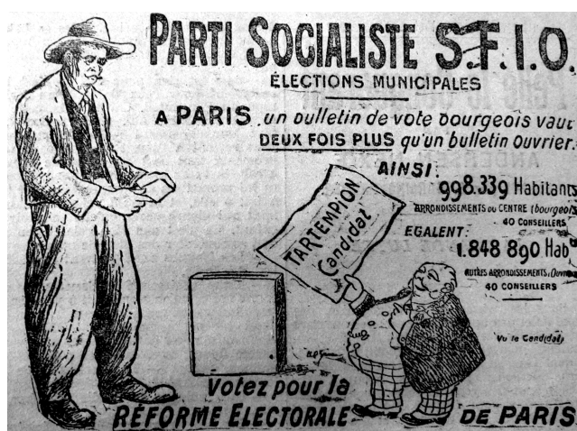
Figure 6 – Affiche électorale de 1912

Or, ce costume de l'ouvrier du bâtiment jouit au début du XX e siècle d'un prestige considérable, il envahit le dessin et l'affiche dans l'imagerie socialiste et syndicaliste de la période. Le peuple organisé, le peuple en lutte est presque toujours figuré sous le costume de l'ouvrier charpentier ou de l'ouvrier terrassier. L'Humanité ou La Bataille syndicaliste , le quotidien de la CGT, se mirent à l'heure du largeot et de la ceinture de laine ( Figure 6 ) :