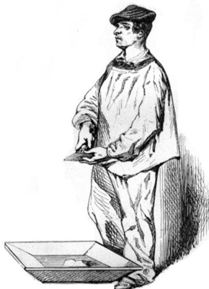
Figure 2 – Le maçon Dessin d'Henry Monnier (gravure de Chevauchet)

Extrait de : Émile de La Bédollière, Les industriels, métiers et professions en France, avec cent dessins par Henry Monnier . Paris, Veuve Louis Janet, 1842, 231 p.