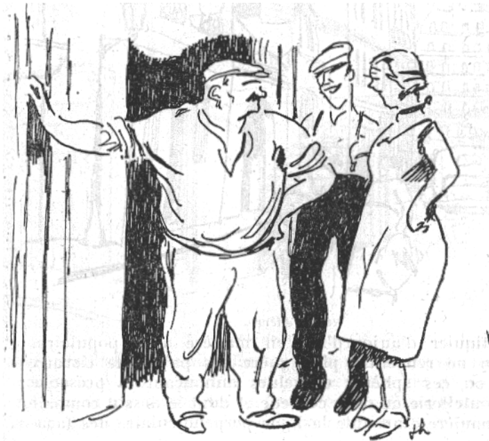
"Voisinages, Soirs d'été, rue de Bièvre, vers 1937-1939".

Ils étaient à la fois intégrés dans le voisinage – par exemple, la coutume voulait que, le soir, on se retrouvait pour bavarder devant la porte de la maison, locataires et commerçants mêlés, les uns debout, les autres assis sur des chaises –, mais les commerçants étaient aussi l'objet de méfiance et de ressentiments : on les soupçonnait de tromper en permanence sur le poids ou sur la qualité, et surtout ils étaient les maîtres du crédit. Pas une famille qui n'ait un jour recouru à ce qu'on appelait "le crédit du quartier", c'est-à-dire l'obtention, auprès des commerçants du voisinage, de délais plus ou moins longs pour payer. L'endettement ouvrier est alors une réalité sociale aussi importante que mal connue. D'où bien sûr, en cas de refus ou de poursuite de la part du commerçant s'il n'était pas payé, un profond sentiment d'injustice et finalement de haine envers ces voisins profiteurs et rapaces.