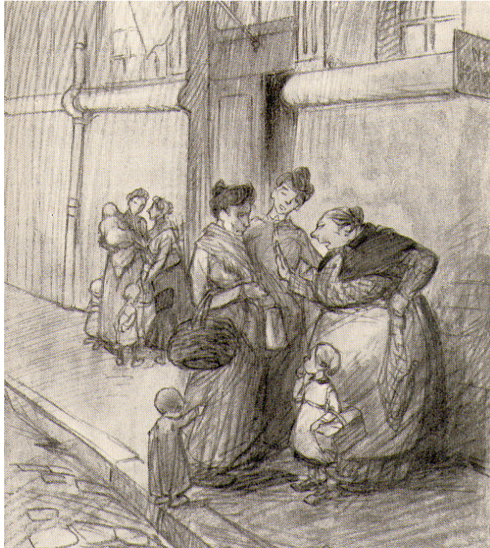
Léon Frapié, La maternelle , éd. Calmann-Lévy, s.d. [1910], p. 2.